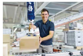
Sistemas de elevación y grúas