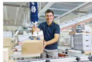
Sistemi di sollevamento e gru