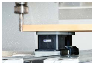
Soluzioni di bloccaggio